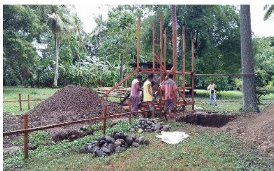
2015 年 7 月