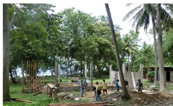
2015 年 8 月