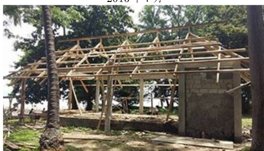
2015 年 9 月