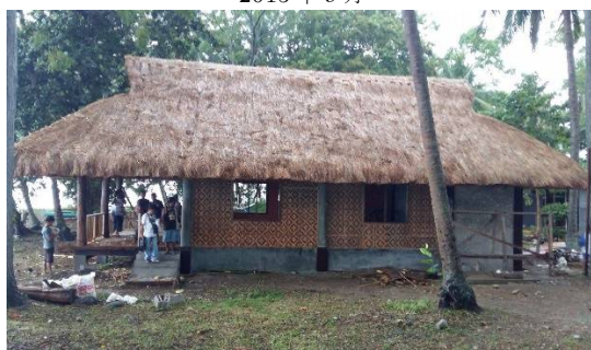
2015 年 11 月